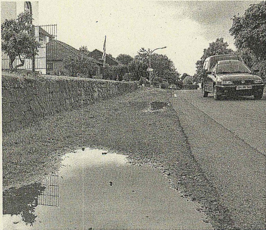
; bekommt endlich einen Fußweg. Die Anwohner freut es.

hen Dorfstraße und Auf dem Winkel erneuert