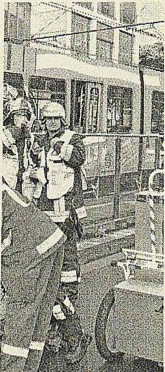
n auf zwei weitere, die an

Baggerfahrer, ein vierein- ; Mädchen und dessen den leicht verletzt, der läuft sich schätzungswei- 00 Euro. WR