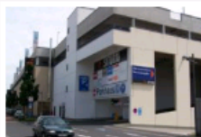
Parkhaus 3: Veybach-Center