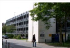
Parkhaus 2: Entenpfuhl/City-Forum