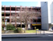
Parkhaus 1: Spiegelstraße